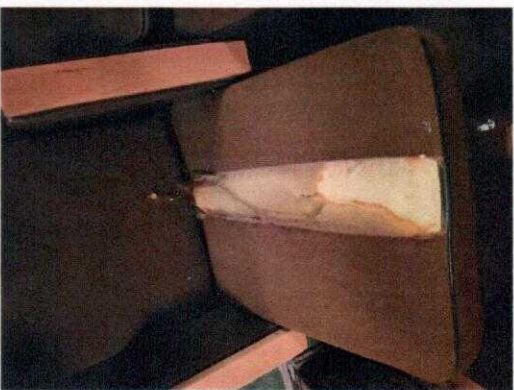
Załącznik nr 2 – Fotodokumentacja stanu aktualnego zniszczonych foteli;