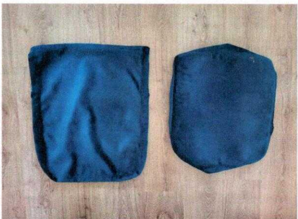
Załącznik nr 3 – Fotodokumentacja prototypu pokrowca wymiennego