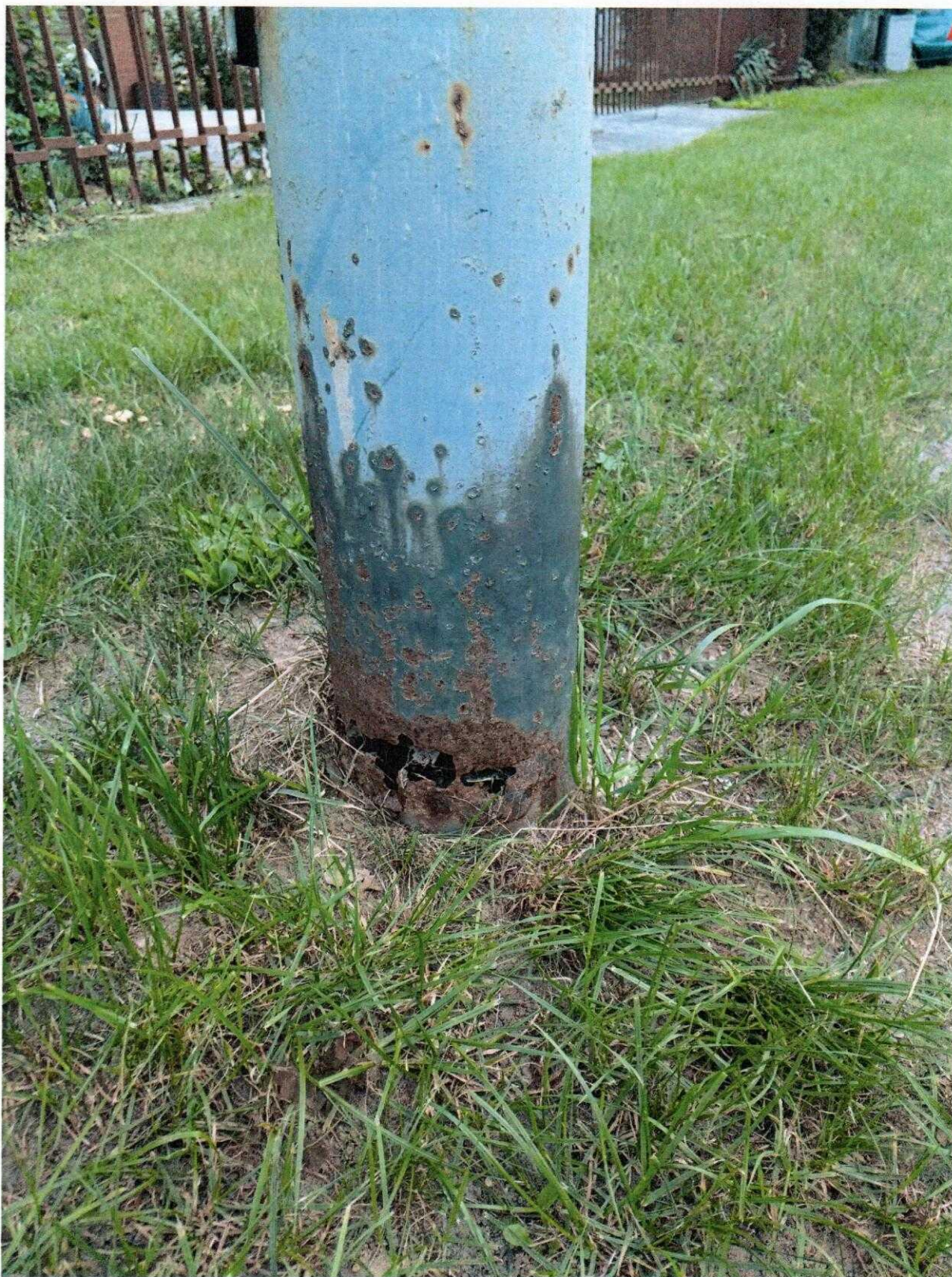
Fot. 2. Ul. Stefana Starzyńskiego w Sycowie – wygląd i stan techniczny istniejącej infrastruktury oświetleniowej