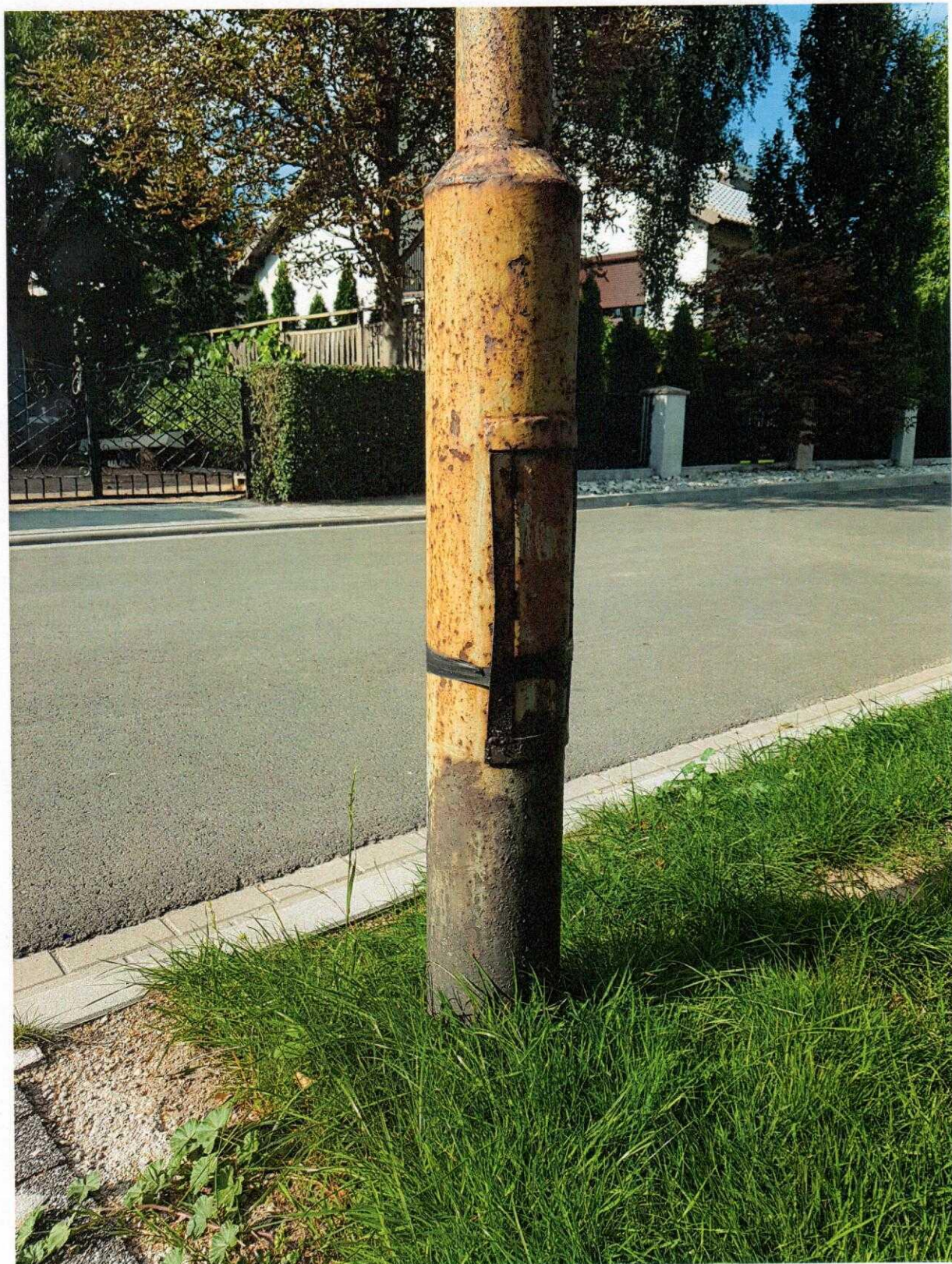
Fot. 6. Ul. Stefana Starzyńskiego w Sycowie – wygląd i stan techniczny istniejącej infrastruktury oświetleniowej