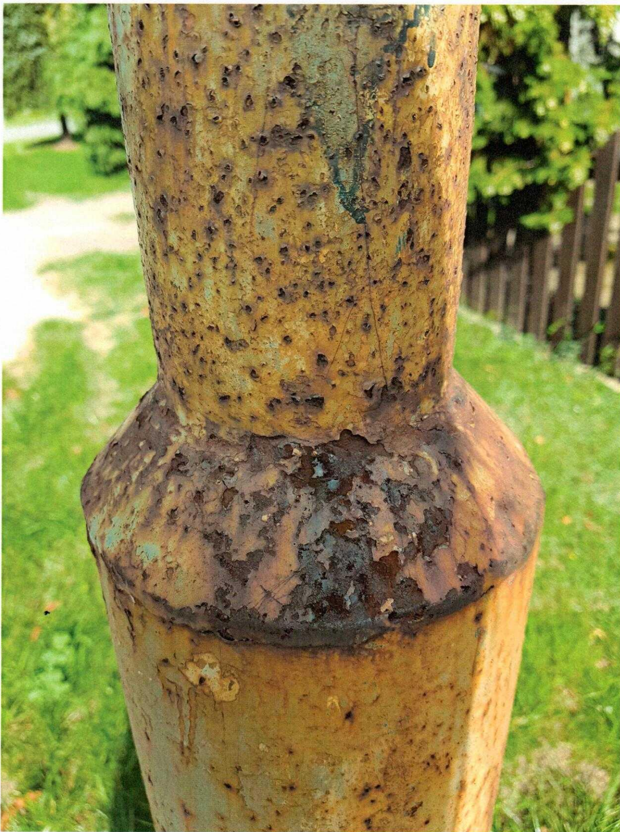
Fot. 4. Ul. Stefana Starzyńskiego w Sycowie – wygląd i stan techniczny istniejącej infrastruktury oświetleniowej