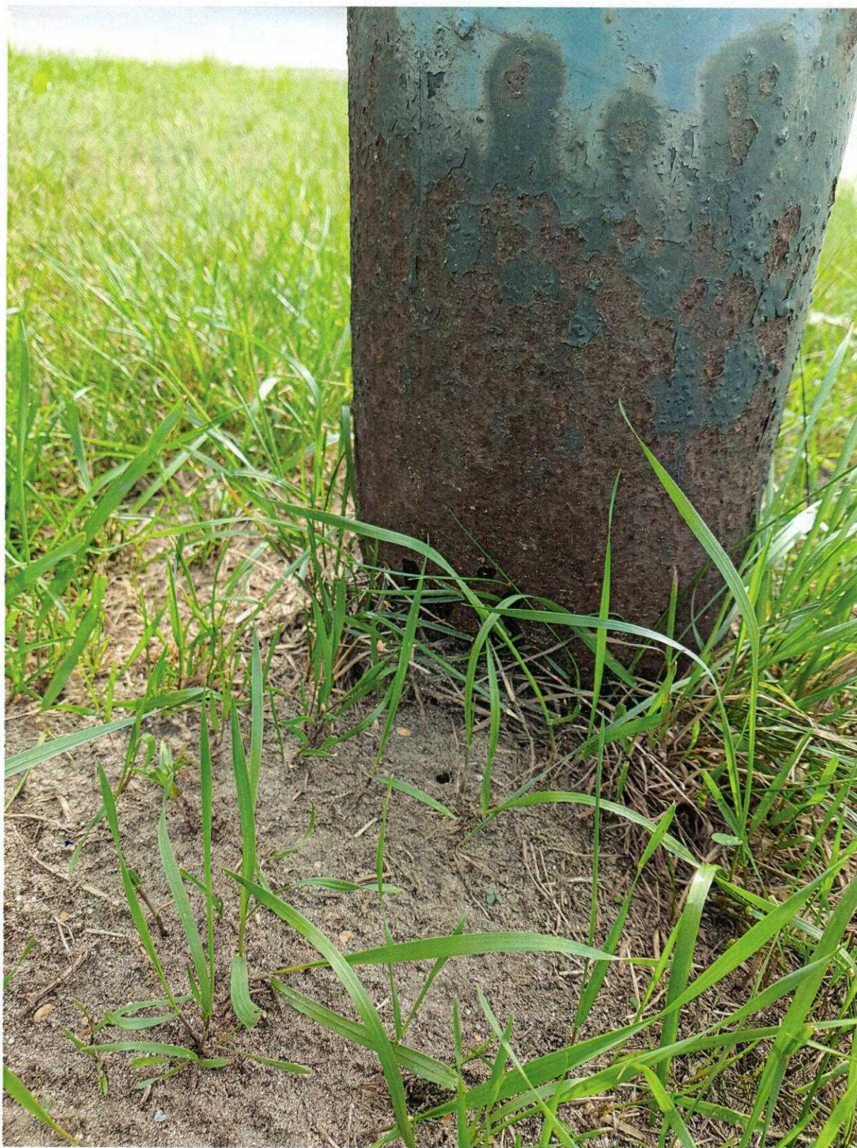
Fot. 3. Ul. Stefana Starzyńskiego w Sycowie – wygląd i stan techniczny istniejącej infrastruktury oświetleniowej