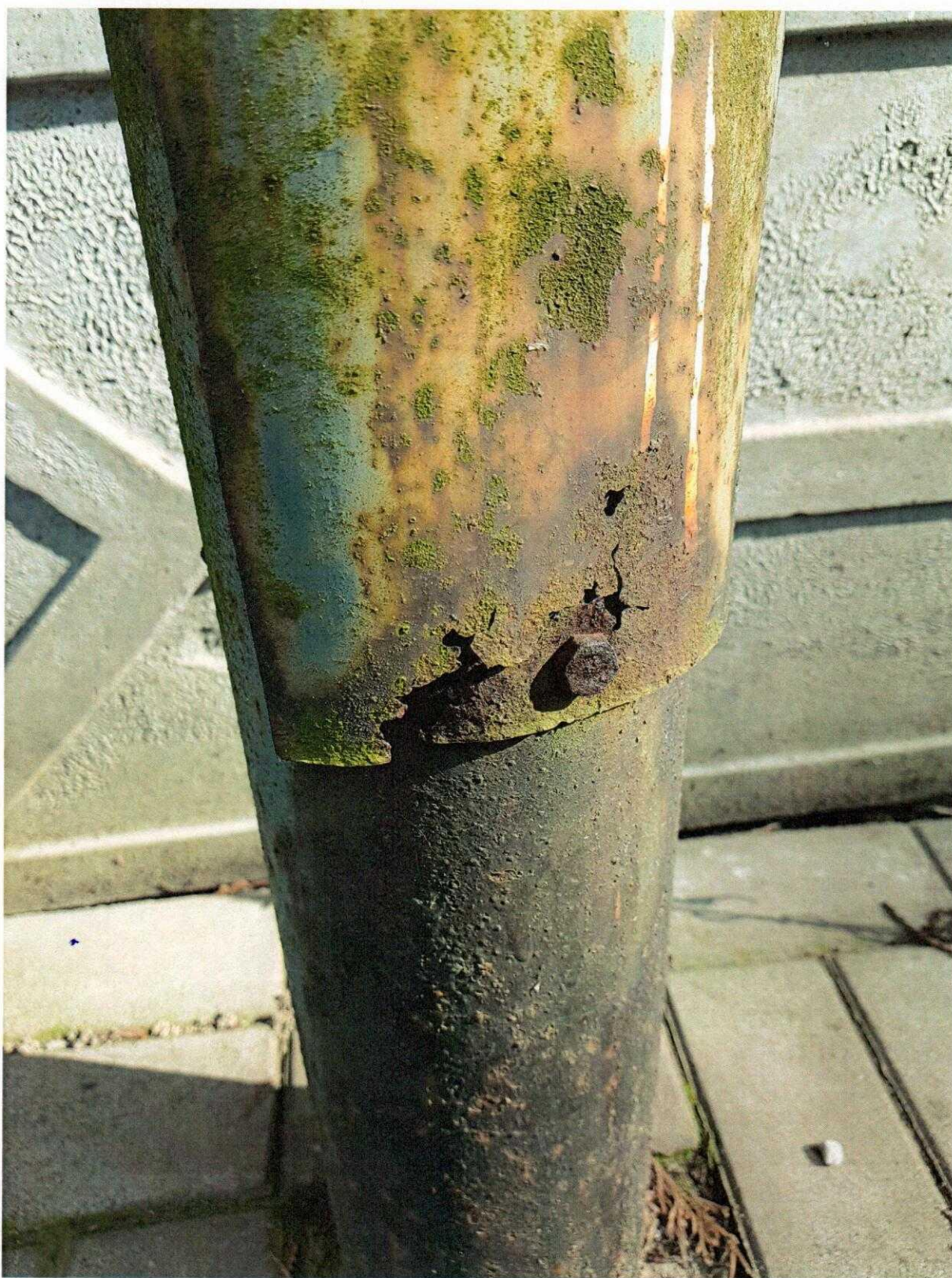
Fot. 5. Ul. Stefana Starzyńskiego w Sycowie – wygląd i stan techniczny istniejącej infrastruktury oświetleniowej