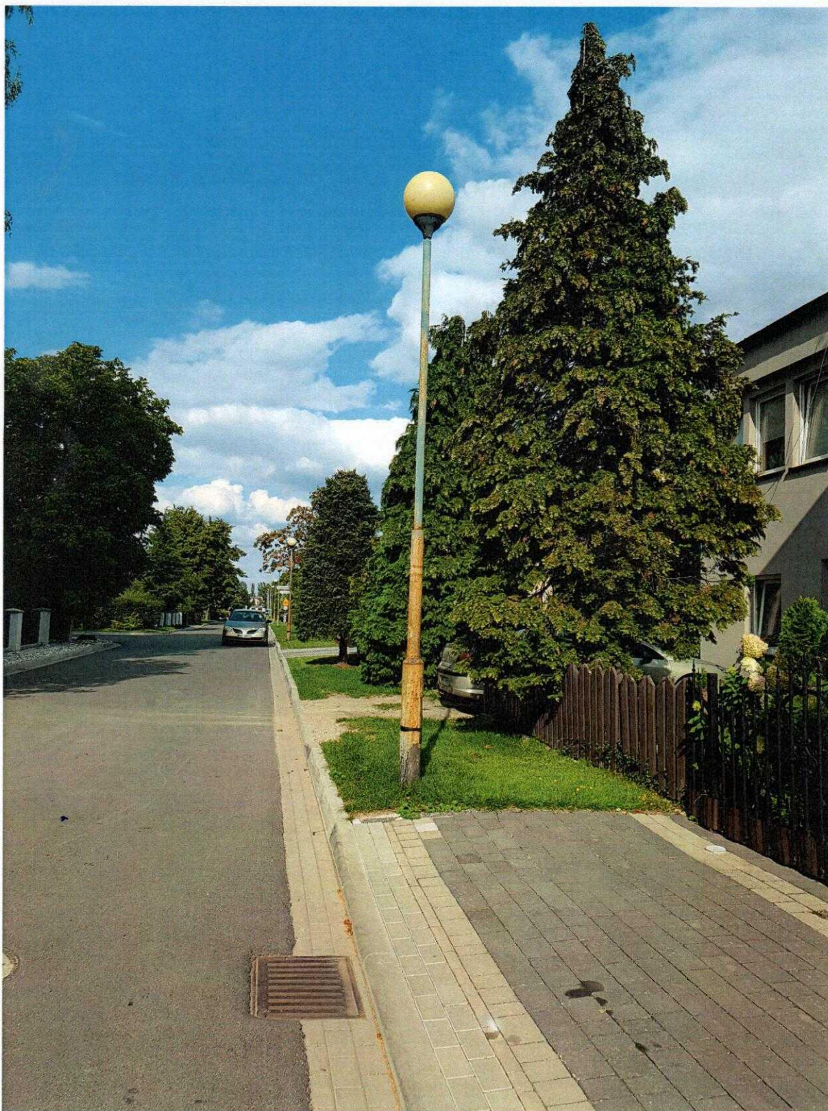
Fot. 1. Ul. Stefana Starzyńskiego w Sycowie – wygląd i stan techniczny istniejącej infrastruktury oświetleniowej